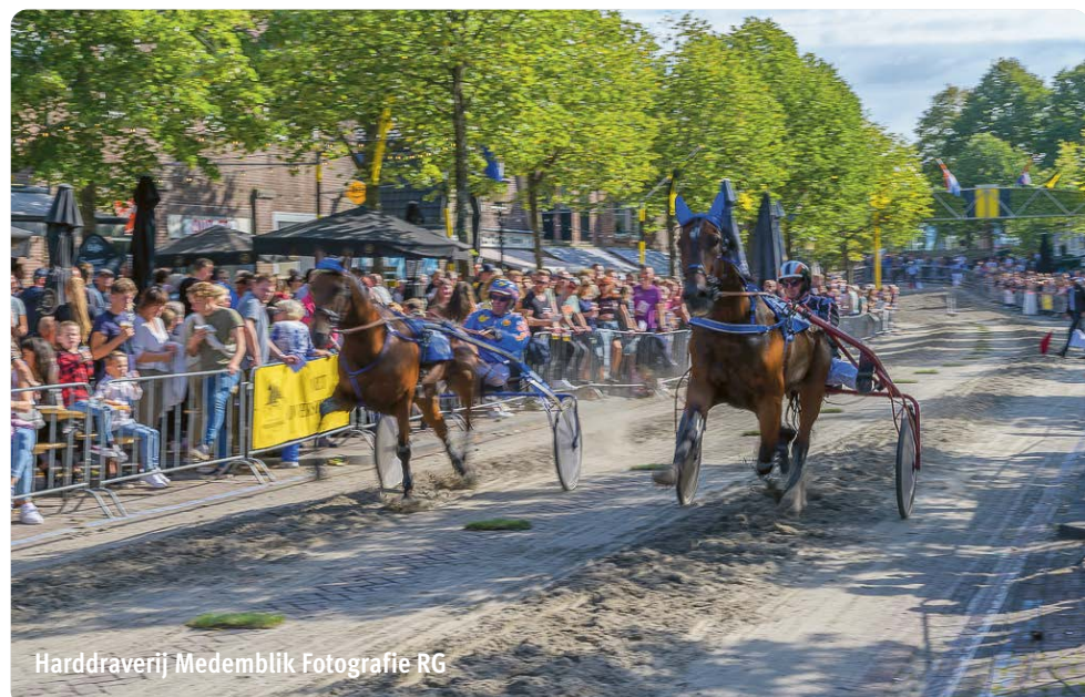
Harddraverij Medemblik